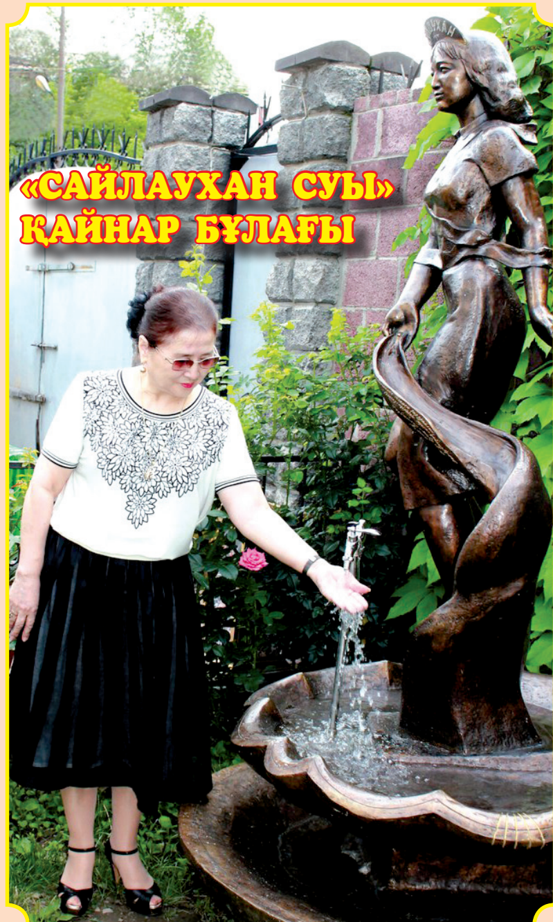
«САЙЛАУХАН СУЫ» ҚАЙНАР БҰЛАҒЫ

Тысымнан хабар беріліп, судың бетіне келіп түсетін суреттер