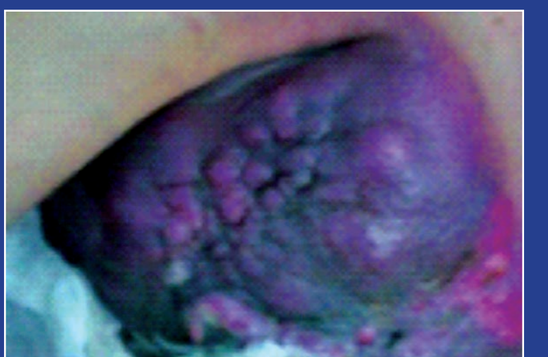
Әйелдің оң жақ омырауында – 4-дәрежедегі обыр. Дәрігерлер емдеуден бас тартқан. Үлкен үмітпен бізге келіп, сырттай емделдік. Таудай шіріген көк еті кейін түсіп, орны тегістеліп кетті.