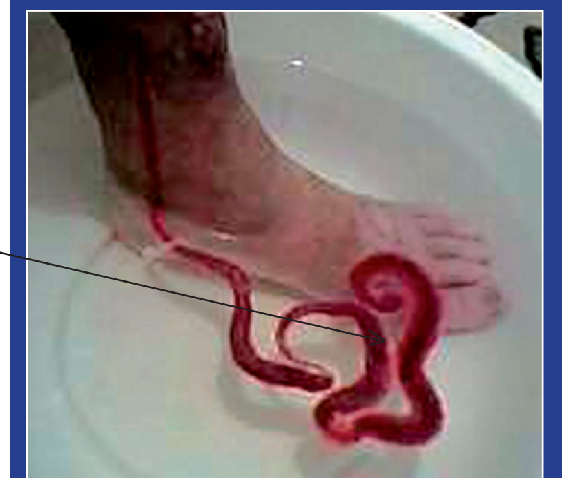
Рак ауруынан шірі бастаған аяқты арнайы күрделі етіп лайымдалған “Сайлау-хан Суымызға” саламыз. Байқайсыз ба, жарадан аққан қан суға түскен бойла араласып кетпей, жылан тәрізді ирелендеп, адам қорқатындай қозғалысқа түсіп тұр. Анықтап, алдыңғы суреттегі құлыпшен салыстыра қарасаныңдар, онда құлыпшен ашылып жатқанын байқайсыздар. Яғни “Сайлау-хан Суы” мен “Сайлау-хан” емдік іс-шаралары осы қарғыстың құлын ашатын бірден-бір кілт емес пе?!

Ұрпақ өрбiту жасындағы ұл-қыздарымыздың белсiздiк пен бедеулікке шырмалуы бiздiң ұлттың да басты демографиялық қасыретiне айналды. Бүгiнде Қазақстанда жаңадан отау құрған отбасылардың 15 пайызы «бедеу» деген ауыр дертті арқалап жүр. Республика бойынша 14 мың әйел – бедеу, мыңнан астам еркек – белсiз. Әйелдердiң – омырауларында, жатырда, жатыр мойнында; ерлердiң – аталық